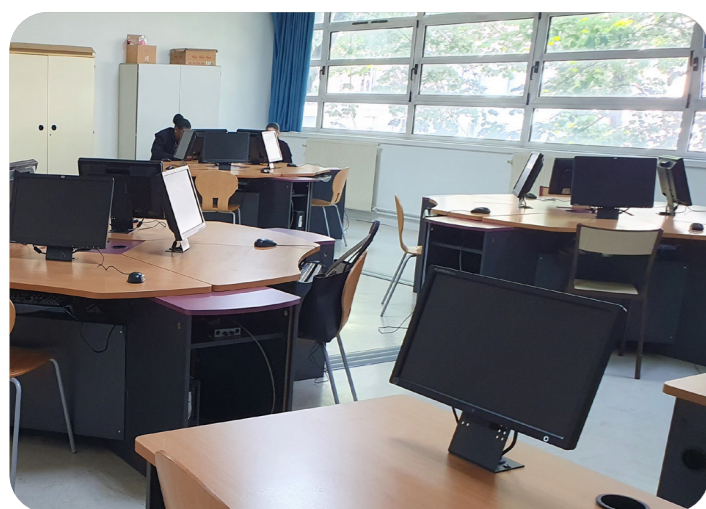
La nouvelle salle informatique