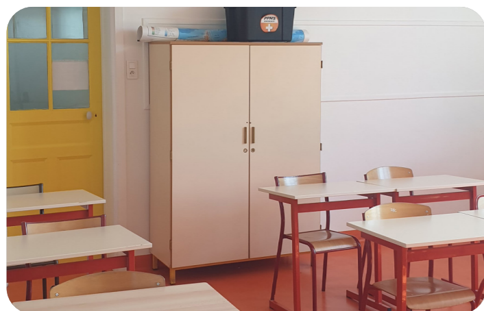
Les salles de classes classiques (ci-dessus) ont été transformées