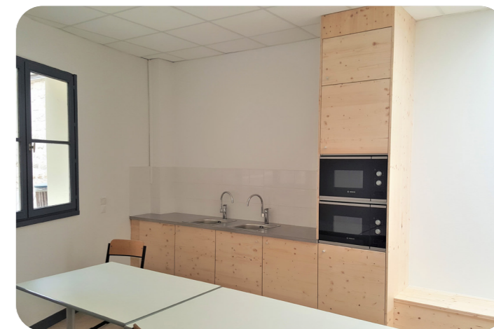
Le nouveau foyer des élèves du lycée Beaugrenelle

Les travaux ont également concerné les espaces communs à tous les lycéens, en particulier le foyer des élèves et le CDI.