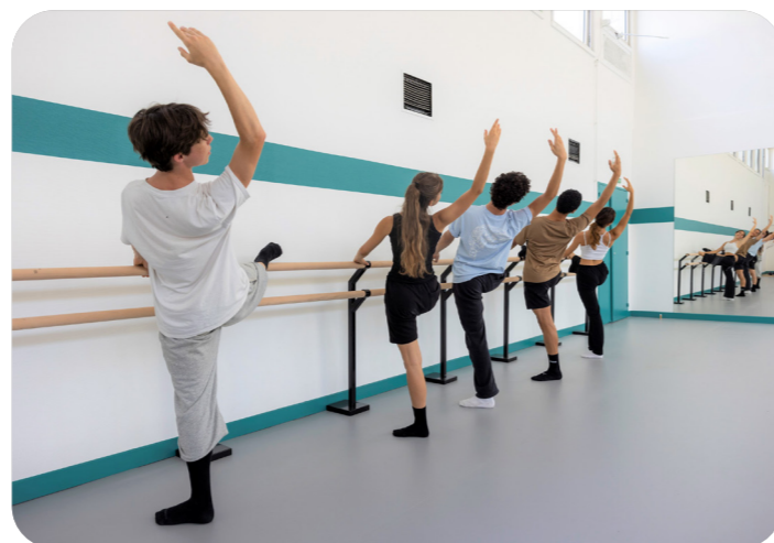
La salle de danse du lycée Henri Bergson, avec revêtement adapté à la pratique des jeunes danseurs, barres et miroirs