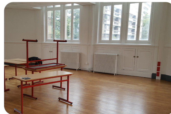
Salle de classe rénovée au lycée Beaugrenelle

Une salle a été aménagée pour l'accueil des élèves de la formation gestion administrative, en accord avec l'établissement. Elle a fait l'objet d'une rénovation esthétique complète (vitrification du parquet existant, dépose d'un évier de service, rénovation architecturale des placards périphériques et du faux-plafond) et d'un agencement dédié (câblage informatique pour un îlot de 12 places, installation d'un écran numérique interactif, libération d'un espace pour des mises en situation réelle).