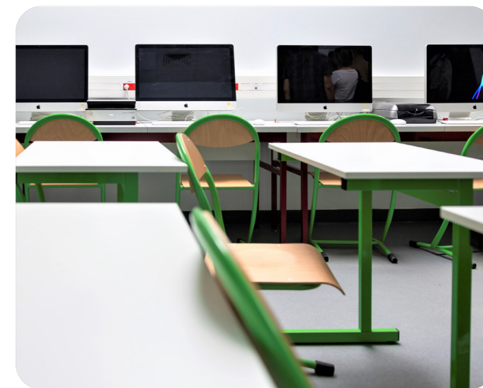
Une nouvelle salle de classe équipée de matériel informatique performant au lycée Louis Armand

Les studios photo et salle de lancement, salle informatique, salle de tirage, laboratoire argentique et salles de traitement numérique sont opérationnelles. Considérant les spécificités de la filière photographie, les travaux ont été réalisés avec un haut niveau d'exigence technique afin de préserver la qualité du matériel et des futures réalisations des élèves : un nouveau système de traitement de l'air a été installé permettant la régulation des températures ainsi que des éclairages de qualité. Tous les intervenants techniques et artistiques de la formation ont été associés à ces travaux afin de garantir les meilleures conditions d'études aux élèves.