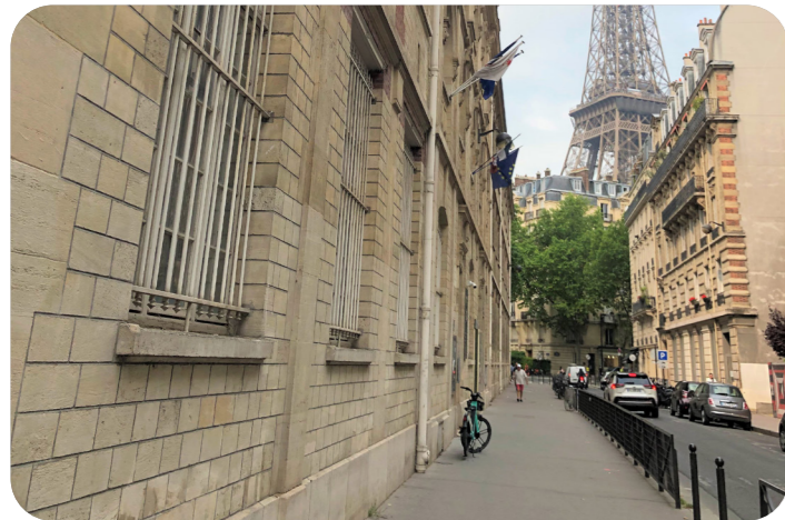
Le lycée Gustave Eiffel a fait l'objet de nombreux travaux en 2023

Une salle a été réaménagée en salle informatique, pour ce faire, les anciennes paillasses ont été ôtées.