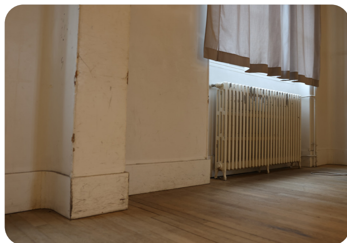
Le lycée Gorges Brassens était vétuste