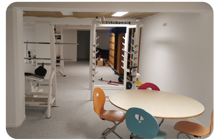
...et après travaux

Les travaux réalisés à l'été 2023 ont permis à la Région de rénover des espaces utilisés par tous les élèves de cet établissement. Ils ont permis de transformer et d'optimiser des espaces jusqu'alors peu mis en valeur.