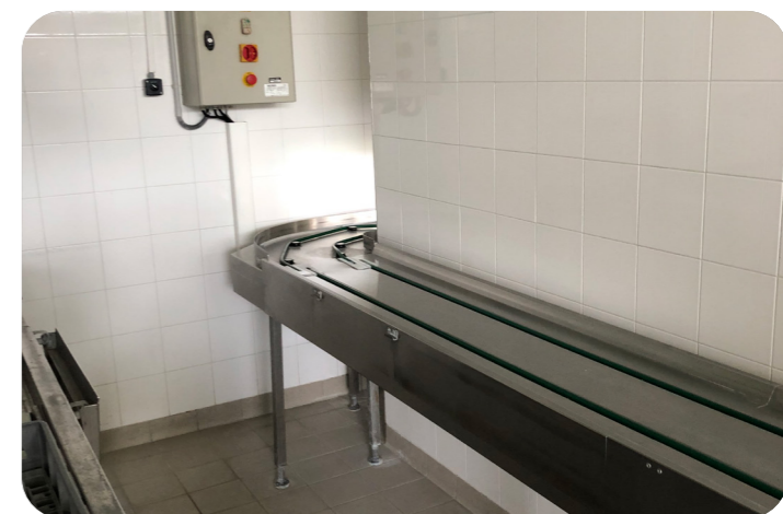
Le tapis d'acheminement des plateaux facilitera le travail des agents des lycées

Des locaux annexes à la salle des professeurs, également dédiés au travail des enseignants, ont été requalifiés : installation du câblage nécessaire aux postes de travail et