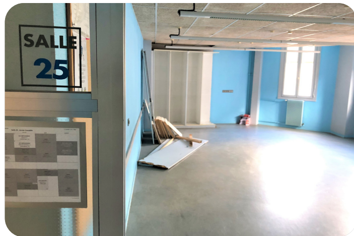
Des salles de cours réaménagées pour mieux accueillir les élèves au Lycée Turquetil

dont une classe à deux options (option animation et gestion de l'espace commercial, et option prospection clientèle et valorisation de l'offre commerciale) du lycée Théophile Gautier, site Charenton (12 e )