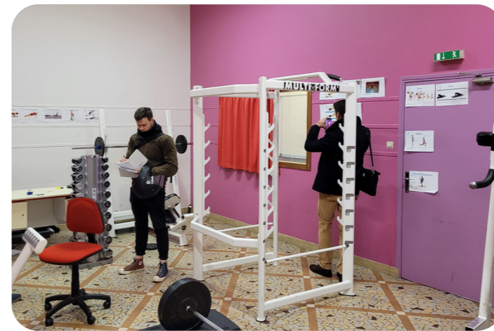
La salle de musculation du lycée Claude Anthime Corbon avant travaux

option animation et gestion de l'espace commercial du lycée Théophile Gautier, site Charenton (12 e )