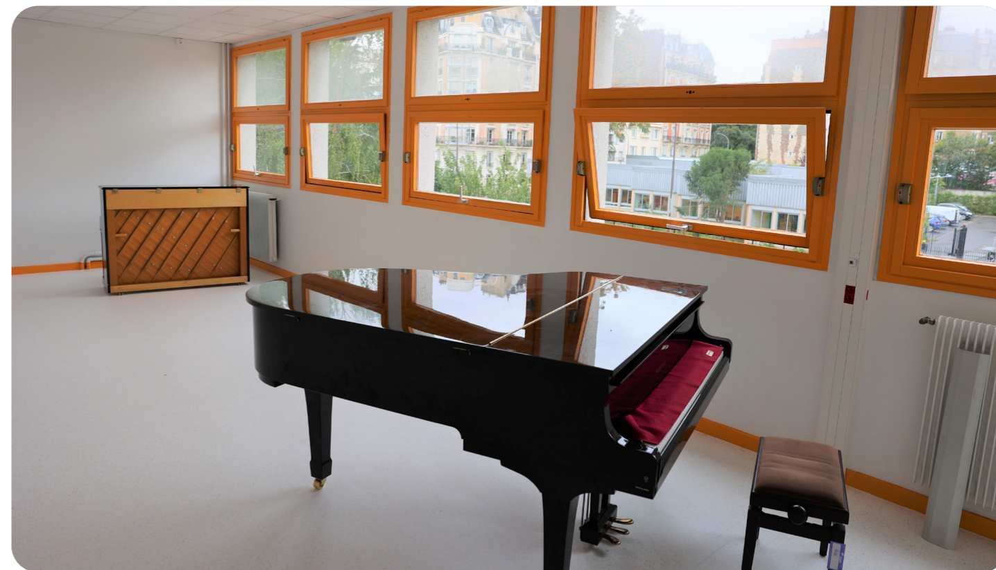
La nouvelle salle de musique du lycée Bergson

musique et de danse de Paris, demandée par le corps enseignant.