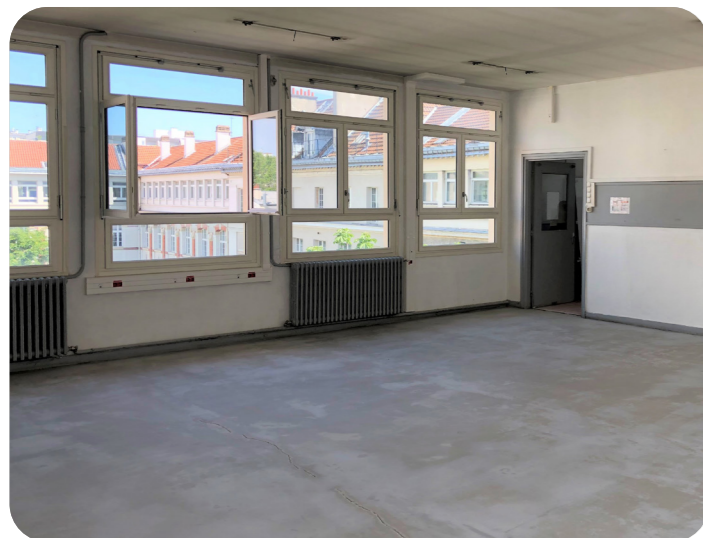
13 salles du lycée Maria Deraismes ont été rénovées

L'établissement dispose désormais de deux PC sécurité certifiés par un organisme agréé pour permettre aux étudiants, à l'issue de leur formation, d'exercer dans les métiers de la sécurité lors de grands événements, tels que les prochains Jeux olympiques et paralympiques de Paris 2024.