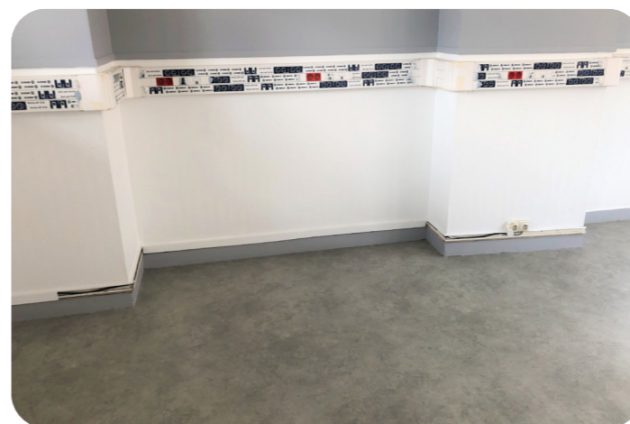
Tout le câblage électrique du Lycée Caroline Dorian a été refait

L'ensemble des travaux de câblage de l'établissement a été réalisé. La sécurisation de l'accès secondaire sera terminée pour la rentrée des vacances d'hiver. Deux salles mixtes du bâtiment E ainsi que la salle des professeurs ont été rénovées. Le revêtement des sols de deux autres salles a été remplacé.