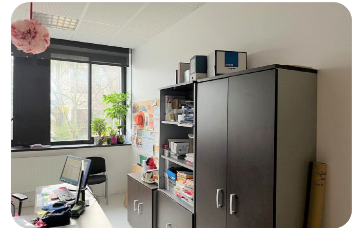
Des bureaux plus lumineux

Une quinzaine de classes ont été rénovées et/ou réaménagées : travaux de peinture, remplacement de carrelages, installations de menuiseries, remplacement de faux-plafonds et d'éclairages, installation de câblages informatiques associés à la nouvelle délimitation des espaces de cours, etc.