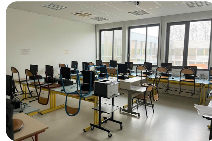
Un nouvel espace informatique au lycée Elisa Lemonnier

Les travaux ont permis de réaliser six nouveaux espaces informatiques pour les élèves, un nouvel espace boutique pour les formations bac professionnel métiers du commerce et de la vente, ainsi qu'une zone de vestiaires et de stockage des valises pour les étudiants en classe d'esthétique.