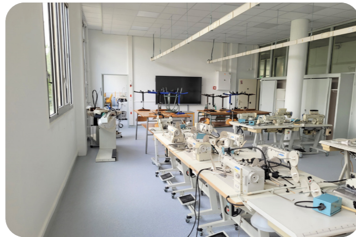
Les ateliers de couture du lycées Marie Laurencin ont été rénovés avec une année d'avance

Les travaux indispensables à l'accueil du bac pro métiers du commerce et de la vente en provenance du lycée Suzanne Valadon ont été réalisés. L'établissement a choisi d'attribuer l'ensemble du 3 e étage à cette formation. Les travaux réalisés ont permis de transformer l'un des ateliers de couture en une salle mixte/informatique et de mettre à niveau le câblage informatique dans l'ensemble des salles. En accord avec l'établissement, le programme de