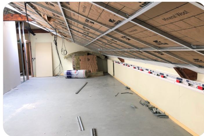
Travaux d'isolation et de mise aux normes électriques

Pour accueillir les nouvelles formations, 6 salles de cours ont été aménagées. Les importants travaux réalisés permettant l'accueil de nouveaux élèves profitent à l'ensemble des étudiants. En particulier : les sanitaires dans les étages du lycée ont été refaits à neuf, le CDI a été réaménagé ainsi que les espaces médicaux. La sécurisation des circulations verticales, avec la création d'un garde-corps toute hauteur