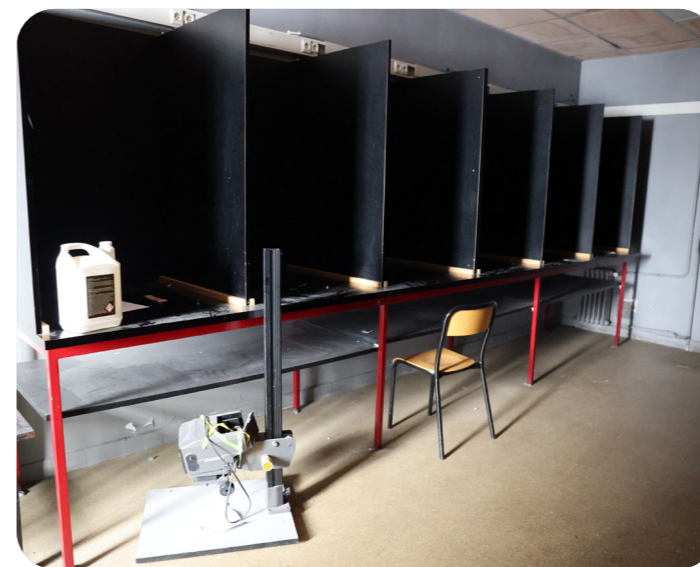
L'ancienne salle informatique du lycée Brassai