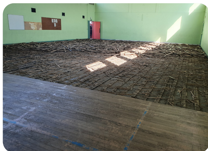
L'ancien gymnase du lycée Henri Bergson durant les travaux de transformation

Une salle de sport du lycée a été modernisée et transformée en salle de danse. Ces travaux importants ont été complétés par la reprise des peintures de la salle et, surtout, l'installation d'un plancher de danse Harlequin, référence utilisée au Conservatoire national supérieur de