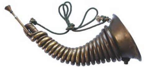
Cor à gidouille

Sur le piano du salon trône un cor à gidouille. Mets-toi dans la peau de cette gidouille et raconte, à la première personne, une fête que donnent Boris Vian et Ursula Kübler. Qu'as-tu observé dans le salon de Boris Vian ? Quelle était l'ambiance de la fête ? Qui étaient les invités ? Quelle musique écoutaient-ils ce soir-là ? Quelles étaient tes sensations ? Les odeurs, les bruits, les sons ?