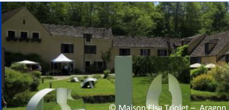
© Maison Elsa Triolet – Aragon

Au cœur d'un parc de 5 hectares, le moulin de Villeneuve vous entraîne dans l'intimité d'Elsa Triolet et de Louis Aragon. Ce moulin du XIII e siècle fut souvent le décor et la source d'inspiration des écrits du couple.