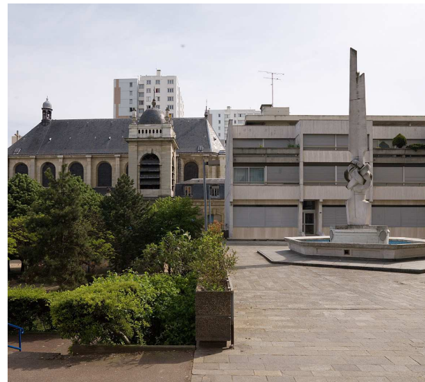
Choisy-le-Roi, la dalle et l'église Saint-Louis.