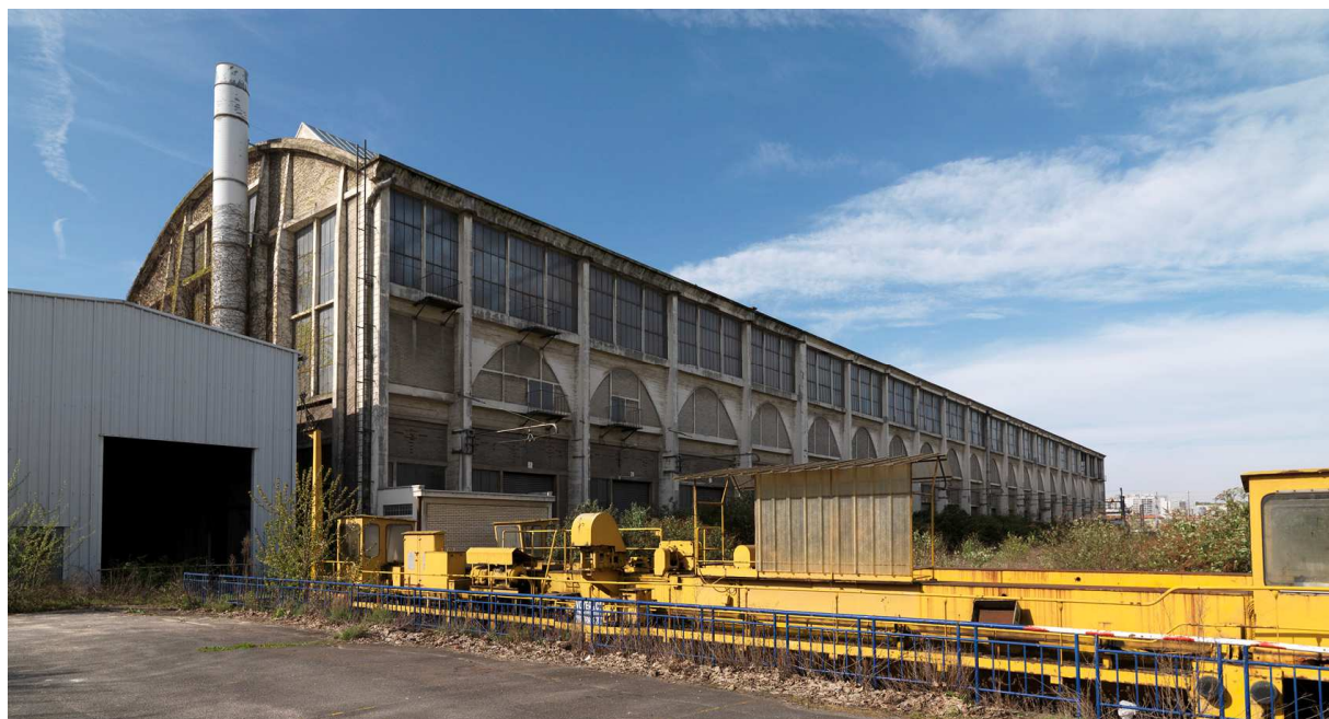
Vitry-sur-Seine, la grande halle de la gare des Ardoines.

De façon générale, cette approche pluridisciplinaire de l'aménagement du territoire est appelé à se multiplier. Pour prendre tout son sens elle doit aujourd'hui s'appliquer à l'échelle des Zones d'Aménagement Concertées et se fonder sur des outils nouveaux : une cartographie interactive et partagée et des fiches d'information sur les éléments patrimoniaux disponibles sur le web.