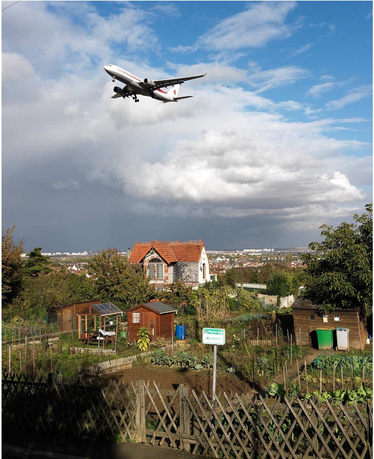
Jardins ouvriers à Villeneuve-le-Roi.