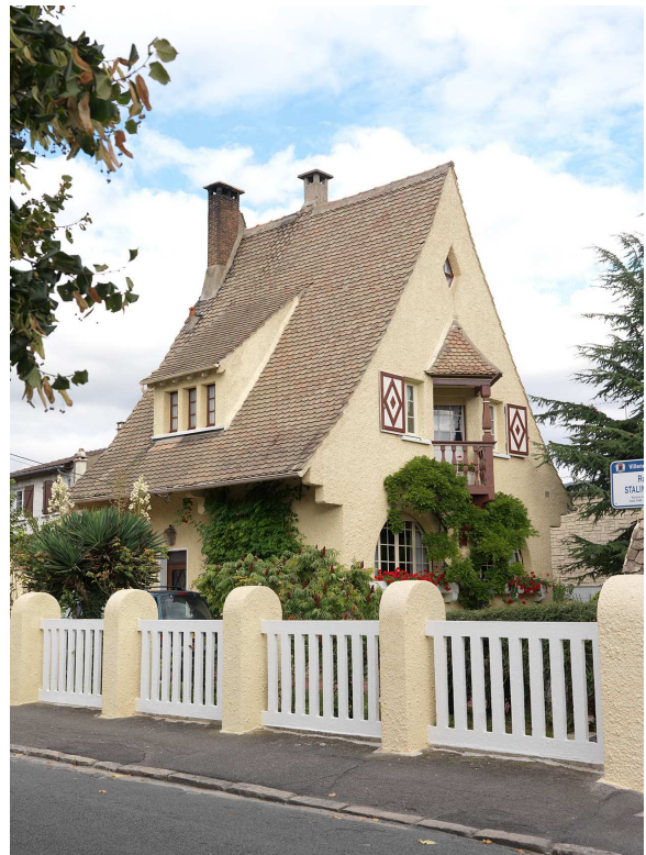
Villeneuve-le-Roi, maison due à l'architecte Gérard Tissoire.