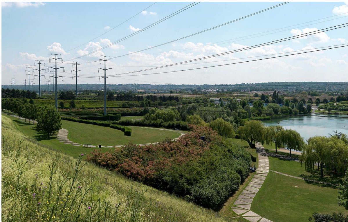
Valenton, parc départemental de la Plage Bleue.