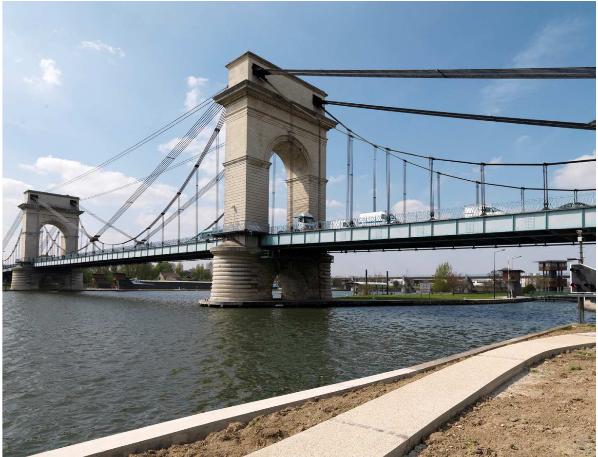
Le pont du Port-à-l'Anglais entre Alfortville et Vitry-sur-Seine.

Traduction opérationnelle du reflexe patrimonial , le diagnostic en cours du territoire de l'OIN s'inscrit dans la vision de l'aménagement durable portée par le SDRIF. Cette synthèse n'est pas la conclusion d'une étude mais plutôt un rapport marquant la fin de la première étape du diagnostic patrimonial du territoire de l'OIN ORSA. Avec ce document il s'agit de montrer les éléments mis à jour par la phase d'étude du terrain et d'ouvrir des perspectives opérationnelles et scientifiques pour des études plus approfondies du territoire.