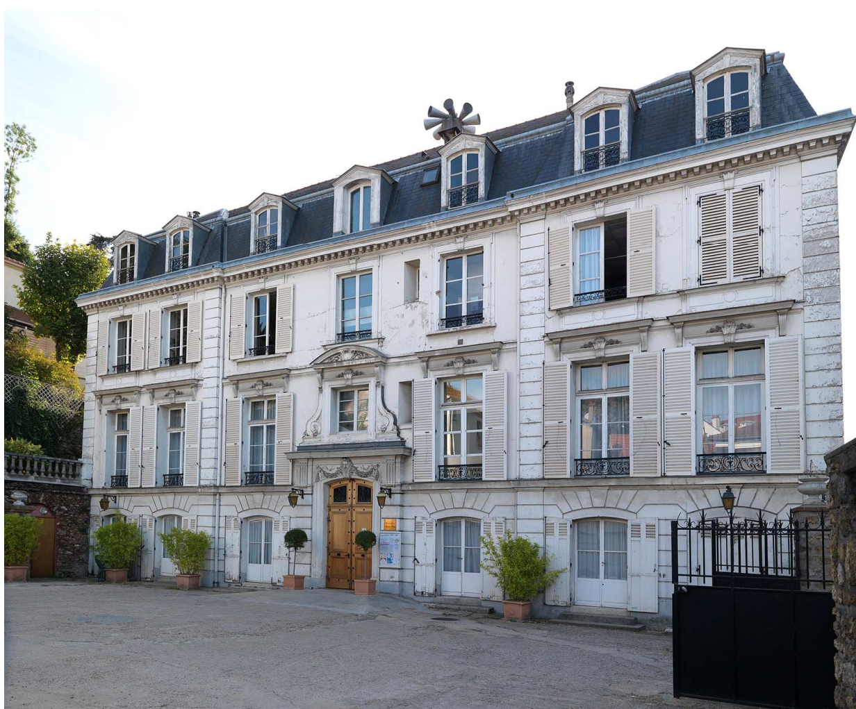
Villeneuve-Saint-Georges, conservatoire municipal.

Toutefois, si cette nouvelle méthode s'inscrit dans une logique d'aménagement du territoire, elle comporte aussi un volet scientifique. En effet, une telle étude doit permettre d'identifier des sujets nouveaux à approfondir. Cette synthèse présentera ainsi quelques pistes de recherche, ouverte par l'étude du patrimoine du territoire de l'OIN ORSA.