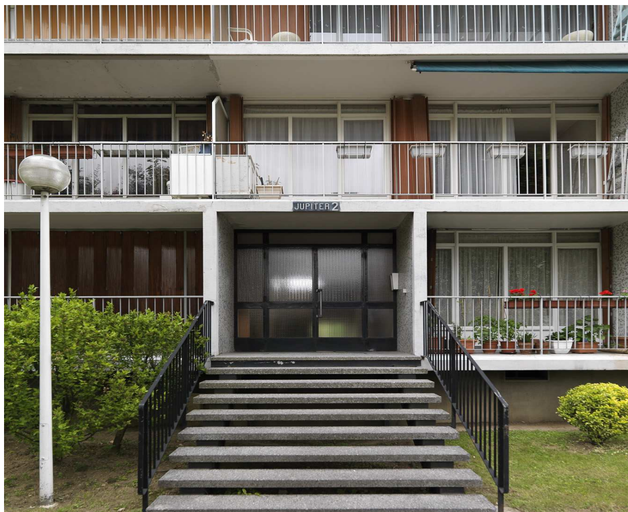
Vitry-sur-Seine, Jupiter 2.