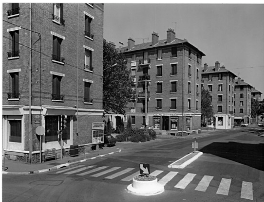
Extrait de la base Mérimée, dossier IA 00126295.