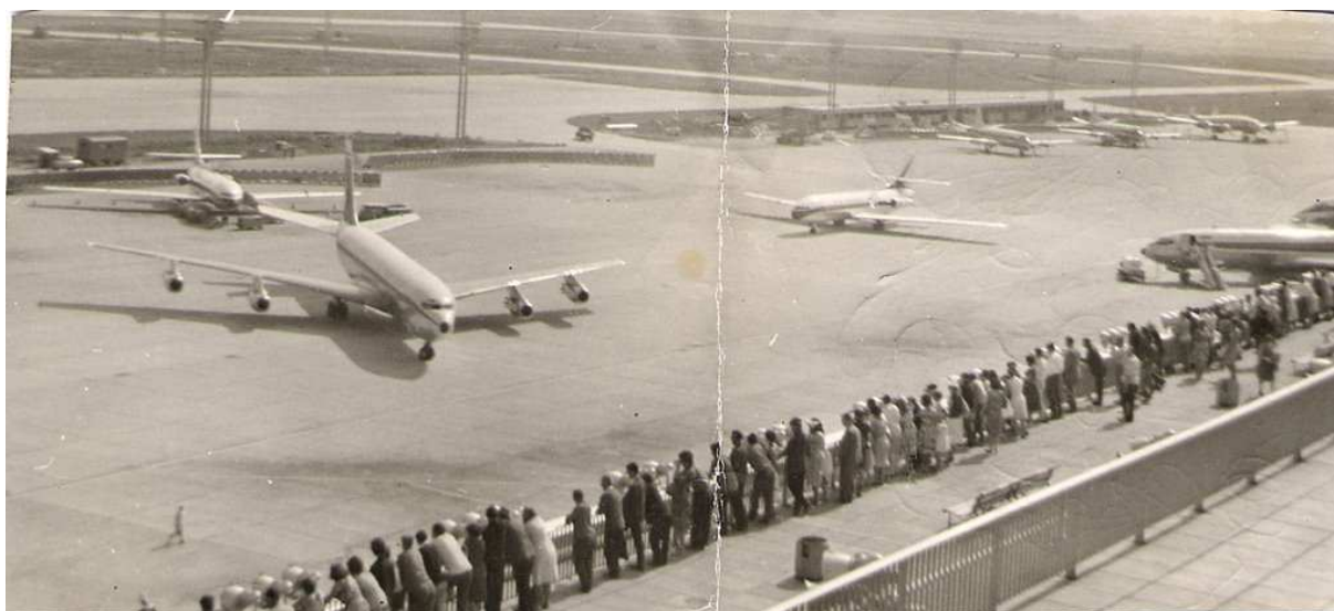
Un dimanche sur les terrasses d'Orly dans les années 60.

Oui j'irai dimanche à Orly. Sur l'aéroport, on voit s'envoler Des avions pour tous les pays. Pour toute une vie... Y'a de quoi rêver. Un jour, de là-haut, le bloc 21 Ne sera plus qu'un tout petit point.