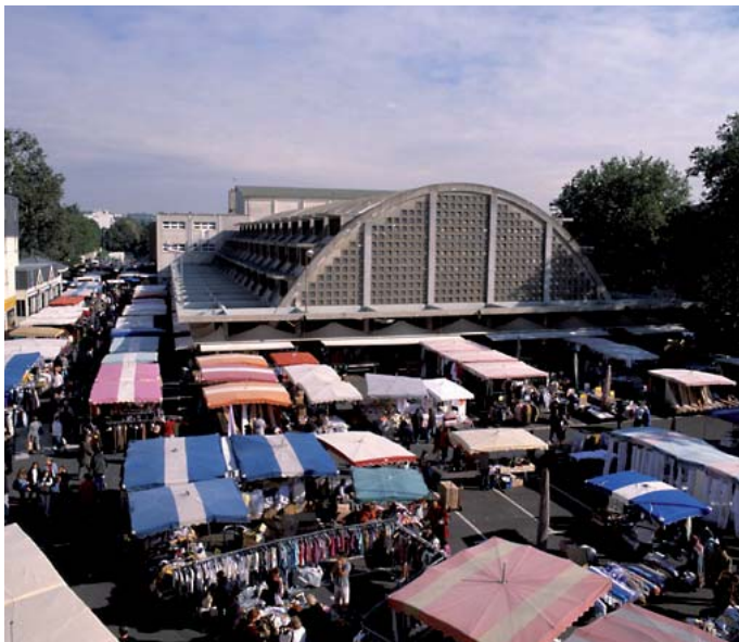
La nouvelle halle et le marché forain

Ainsi, tenter d'expliquer l'évolution urbaine et l'histoire de la construction de Juvisy par l'essor et le développement des réseaux, apparut d'abord comme une perspective séduisante tant ces relations semblent déterminantes dans la constitution du tissu urbain, quel que soit le secteur choisi. Mais cette approche demandait à être modulée dès lors qu'elle semblait reposer sur une hypothèse ici partiellement valide. En effet, nombre d'études urbaines 2 ont, ces dernières années, démontré que la plupart des villes doivent moins leur implantation et leur développement à leur insertion dans un réseau qu'à des fonctions propres qui, généralement, précèdent l'établissement d'un réseau : villes marchés, capitales politiques, centres administratifs, sièges d'institutions religieuses, villes de garnison, lieux de transformation, places d'échanges locaux ont souvent précédé leur inscription au sein de grands réseaux nationaux qui sont nés ultérieurement de la mise en relation de ces centres anciennement actifs. Ce qui est vrai de l'histoire et du développement d'antiques cités comme Paris ou Lyon, et de leurs tardives relations réciproques, l'est – dans une moindre mesure – pour Juvisy dont l'origine rurale et monastique doit moins au passage supposé d'une ancienne voie romaine qu'à un site propice aux cultures et à l'installation d'un modeste prieuré.