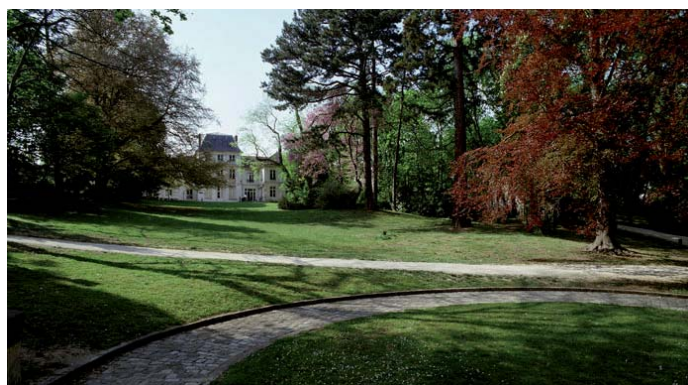
Le parc des Belles fontaines, ancien parc du petit château de la Cour de France, élevé partiellement vers 1748.