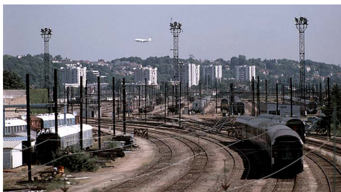
Le triage de Juvisy-Athis, en 2005, dix ans après sa fermeture.

Ainsi, dès les années soixante-dix, celui-ci ne cesse de réduire son activité tandis que la gare de banlieue connaît une croissance constante du nombre de voyageurs (plus