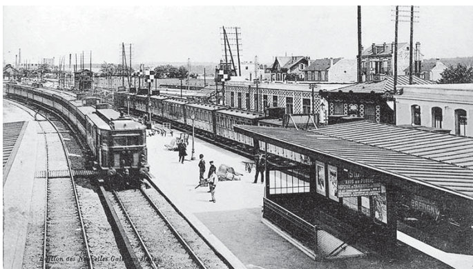
La gare voyageurs de Juvisy vue en direction de la bifurcation entre les réseaux P.O. et P.L.M. : au premier plan, une rame de banlieue tractée par une automotrice électrique. Carte postale (vers 1910).

Après avoir favorisé l'essor d'une partie de la commune, le carrefour ferroviaire de Juvisy va, à l'issue de la Seconde guerre mondiale, plonger la ville dans la ruine et le chaos, dont elle ressortira reconstruite et modernisée après des décennies d'effort et de chantiers (1944-2007). La concentration d'installations et le nœud ferroviaire font alors de Juvisy un point stratégique pour la défense du territoire envahi : les Alliés décident d'en priver la contre-offensive allemande par une suite de bombardements (d'avril à août 1944) qui, visant les installations ferroviaires, détruisent près du tiers de la commune, sans compter les dégâts collatéraux causés aux communes voisines, elles aussi sinistrées. Le triage de Juvisy-Athis