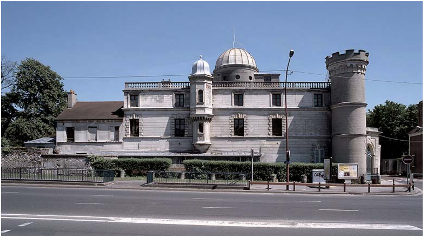
L'observatoire Camille-Flammarion : façade du bâtiment principal vue de la R.N.

Pour autant, la collection des Cahiers du patrimoine offre la souplesse nécessaire pour présenter une étude urbaine fondée sur l'analyse des rapports complexes et fluctuants qu'entretiennent une ville et des réseaux multiples. Le bilan de cette opération se trouverait faussé sans l'aveu de la satisfaction réelle d'avoir pu aborder la présentation d'une commune – étendue à l'échelle d'un territoire, l'agglomération entourant Juvisy –, traitée sur le mode d'un cas d'école, tant la problématique et l'approche retenues à Juvisy-sur-Orge auraient aussi bien pu s'appliquer à des sites analogues.