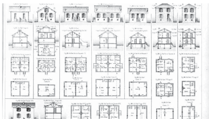
Plans et élévations des maisons-types de la cité coopérative Le Cottage d'Athis, maisons conçues par l'architecte Emile Bénard à l'initiative de la Compagnie du chemin de fer d'Orléans pour ses employés travaillant à Juvisy et à Athis-Mons. 1898. BnF Topo Va Essonne. Cliché J.-B. Vialles. Document Bibliothèque nationale de France

La seconde période (1840-1944) qui couvre un siècle d'implantation et d'expansion ferroviaires, retrace la nature et la multitude des relations existant entre le chemin de fer et la ville, à travers les installations de réseaux multiples (P.O., P.L.M., G.C.) ainsi que par le biais des équipements et des constructions engendrés par cette zone d'activité vaste et complexe. Dans un premier temps (1840-1914), l'étude du paysage juvisien consiste donc à étudier la mise en place, le développement et la complexification des installations ferroviaires, parallèlement à l'essor du transport de passagers et du triage des marchandises. Cette concentration ne reste pas sans effet sur l'organisation et la construction du bourg. En termes d'habitation, ce sont, d'abord, de grosses maisons de villégiatures qui accueillent des Parisiens qui profitent des progrès de la desserte ferroviaire ; puis ce sont des lotissements modestes qui se multiplient dans le parc inférieur, et une cité de cheminots qui se construit à Athis-Mons pour loger le personnel travaillant dans les gares, les triages et les ateliers annexes.