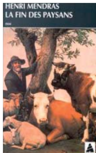
La fin des Paysans, Henri Mendras.

Celui-ci met en place une abondante législation qu'il ne nous appartient pas d'étudier ici mais dont on retiendra la loi sur la Protection de la nature de 1976 et la loi Paysage de 1993, la préservation du paysage, comme patrimoine naturel continuant de nos jours.