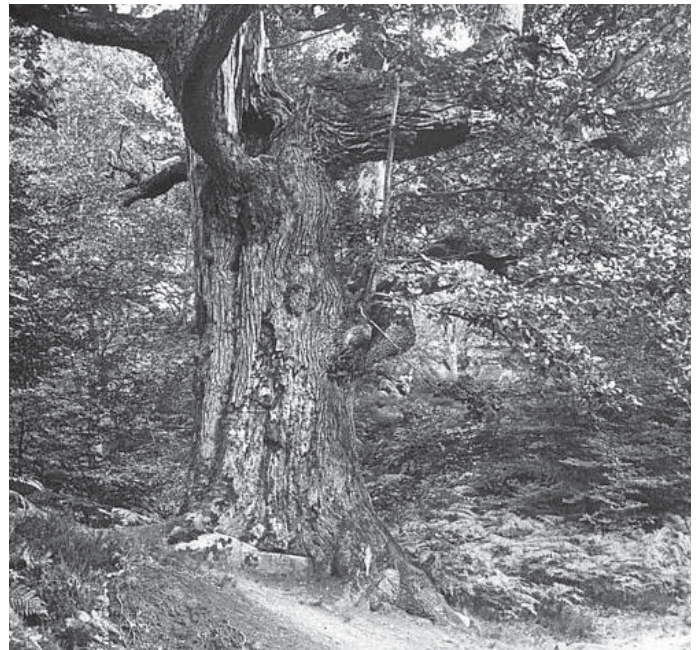
Forêt de Fontainebleau, le Charlemagne (chêne), Archives photographiques (Médiathèque de l'architecture et du patrimoine), © CMIN.

- la référence constante à la peinture. Le « paysagiste » au XIXe siècle est le peintre de paysage et le Grand dictionnaire Larousse, en 1875 précise que le paysage est « une vue champêtre considérée au point de vue de ses qualités pittoresques », c'est-à-dire reconnue par les peintres paysagistes. C'est le 29 novembre 1850 que la Commission des Monuments Historiques examine « une réclamation adressée au ministre par un certain nombre de peintres paysagistes au sujet d'un projet conçu par l'administration des forêts d'abattre les futaies du Bas-Bréau », en forêt de Fontainebleau, lieu de prédi-