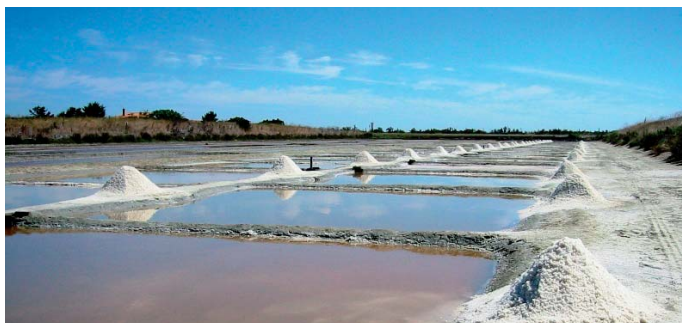
Site protégé : Les marais salants de l'île de Ré

un intérêt scientifique « tant du point de vue de la minéralogie, de la paléontologie que de la botanique et de la zoologie. 11 » Cette première tentative de définir un patrimoine naturel et de justifier sa protection est à souligner. Elle est initiée par les associations, notamment la Société nationale d'acclimatation, qui cherche à protéger des espèces animales et végétales en péril. Il y a là, en germe, une nouvelle extension de la notion de patrimoine que le service des monuments historiques pourra difficilement continuer à gérer.