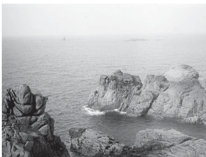
L'île de Bréhat.

Le rapporteur du projet insiste fortement sur l'extension de la protection à de nouveaux types de sites, les sites présentant