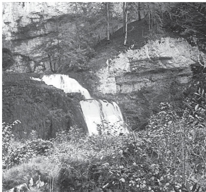
La source du Lizon.

Concernant les sites, les propositions de Beauquier et de Dubuisson présentent des caractères communs. Elles s'inspirent de la loi de protection des Monuments historiques : la