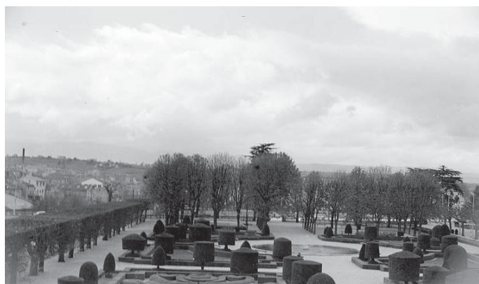
Le jardin de l'évêché de Castres

Les sites concernés par ces deux propositions sont peu nombreux et bien définis. Ce sont les paysages « grandioses », les « beautés naturelles » qui ont inspirés les peintres. Beauquier écrit dans l'introduction de son texte : « L'État veillera avec un soin religieux sur un tableau de maître qui représente un paysage et il en