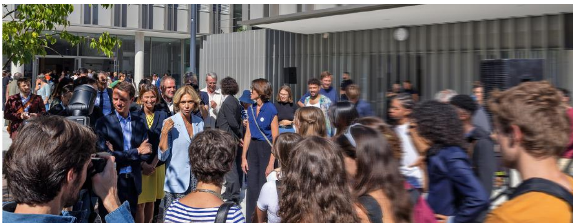
Inauguration du lycée neuf de Vincennes (94), le 2 septembre.