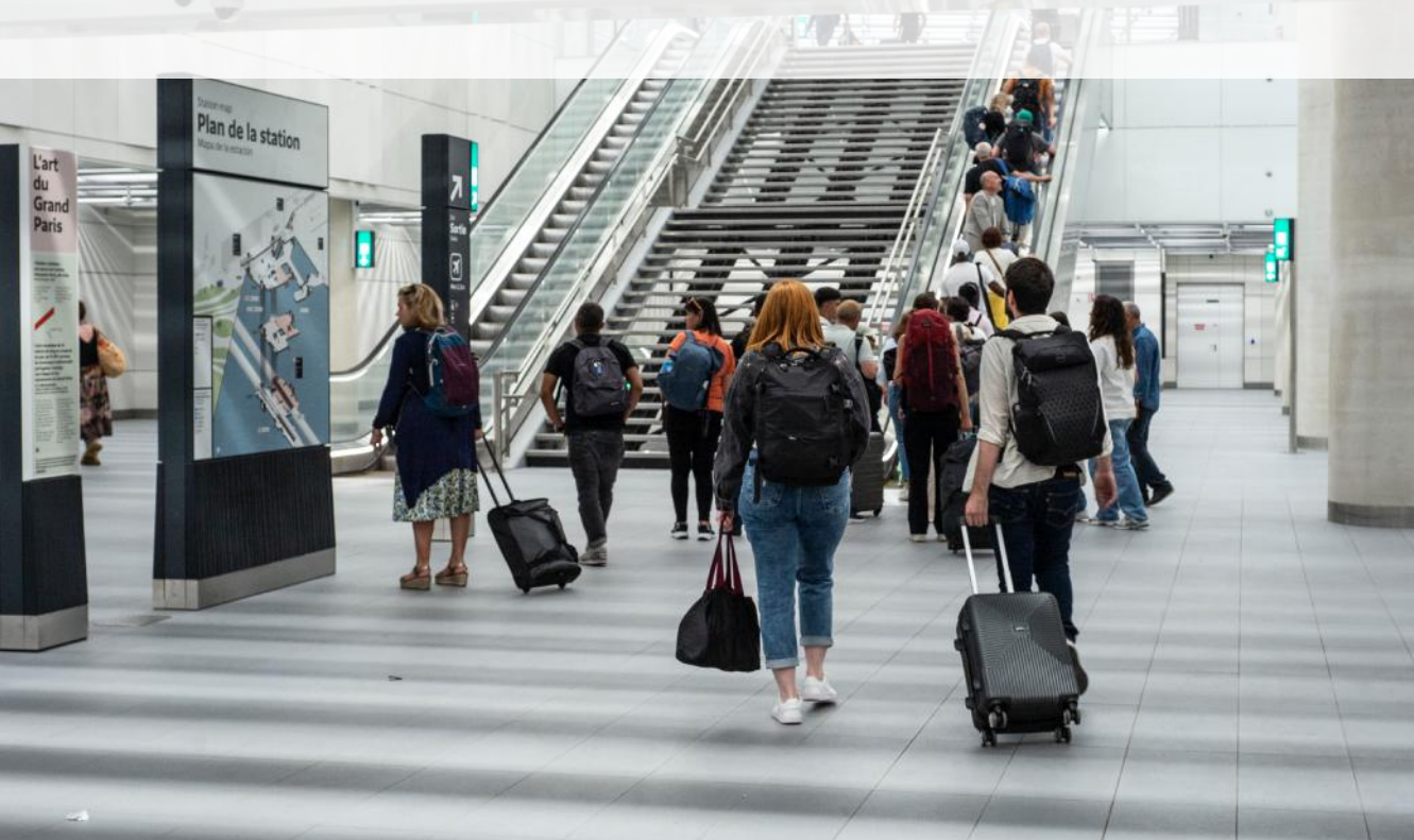
La ligne 14 prolongée met l'aéroport d'Orly (94) à moins de 30 minutes de Paris.