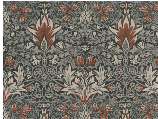
William Morris, Snakeshead, dessin de 1876, toile de coton imprimée à la fin du 18 e siècle, Londres, William Morris Gallery, inv. F12