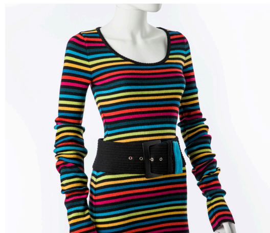
Robe pull, Sonia Rykiel (1930-2016), 1996 Jersey de laine et ceinture en maille de laine, Archives Rykiel, A.V.SR.PE.1996.76