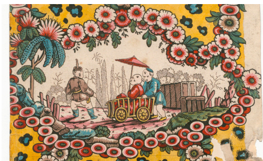
Jeux d'enfants, Maquette pour impression textile, 1789 Gouache sur papier, Manufacture Oberkampf