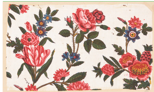
Echantillon de l'album Feray, toile de coton imprimée à la fin 18 e siècle, Manufacture Oberkampf N°INV.000.4.37

En Europe depuis la Renaissance, les artistes ont participé à la création d'objets textiles en produisant des cartons de tapisseries, pour de prestigieux commanditaires, empereurs, rois ou papes. Le développement d'une activité